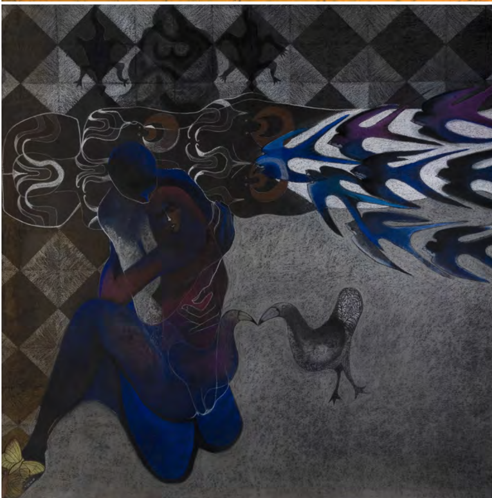
” The Lovers of Zumpa Beach II” Technique: pastel on canvas Size: 87 x 87 cm