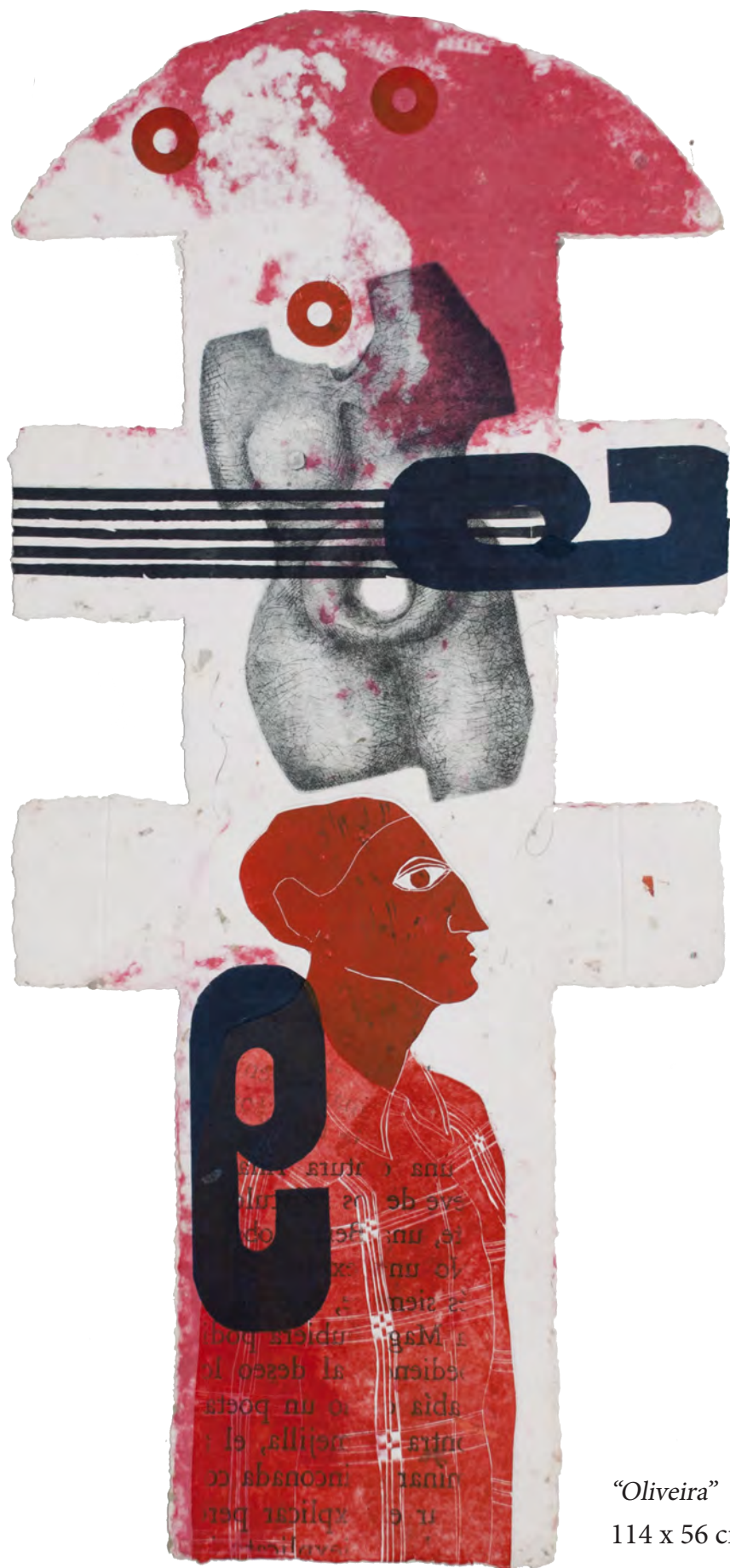
"Oliveira" 114 x 56 cm