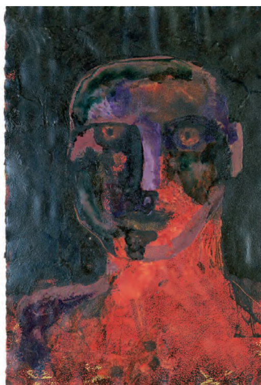
"Argentine Triptych '78"

Technique: encaustic painting + collagraph + monotype