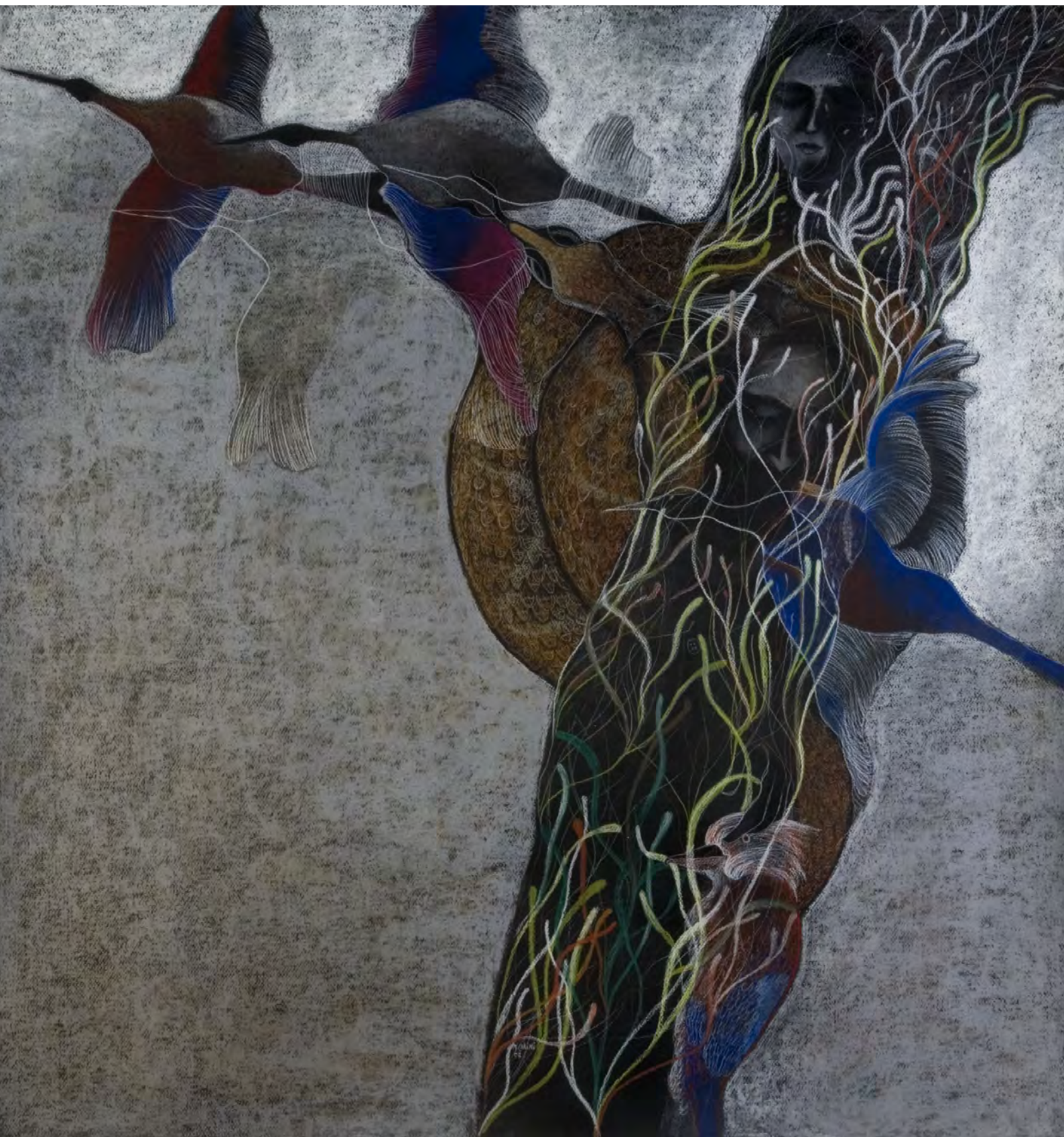
"The Writer from the Red Earth" Technique: pastel on canvas Size: 100 x 100