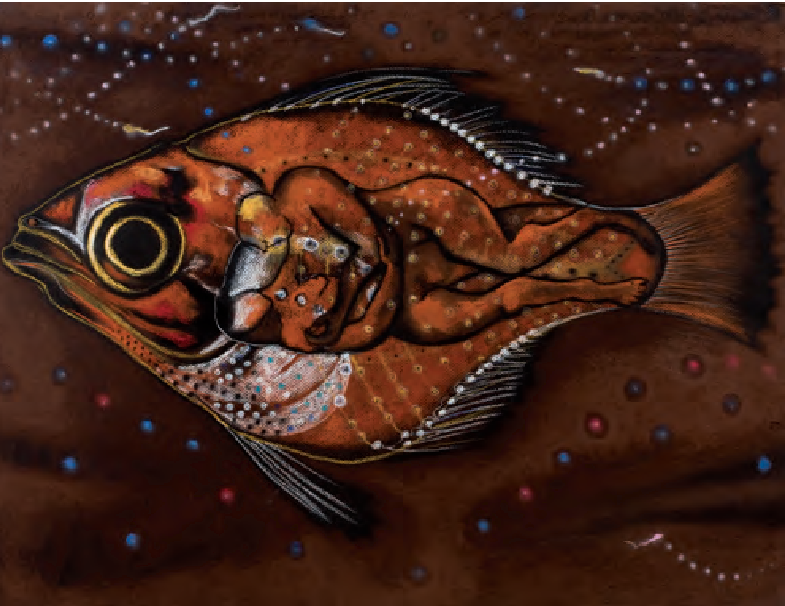
"Trans-oceanic Travelers" Technique: oil on canvas Size: 50 x 65 cm