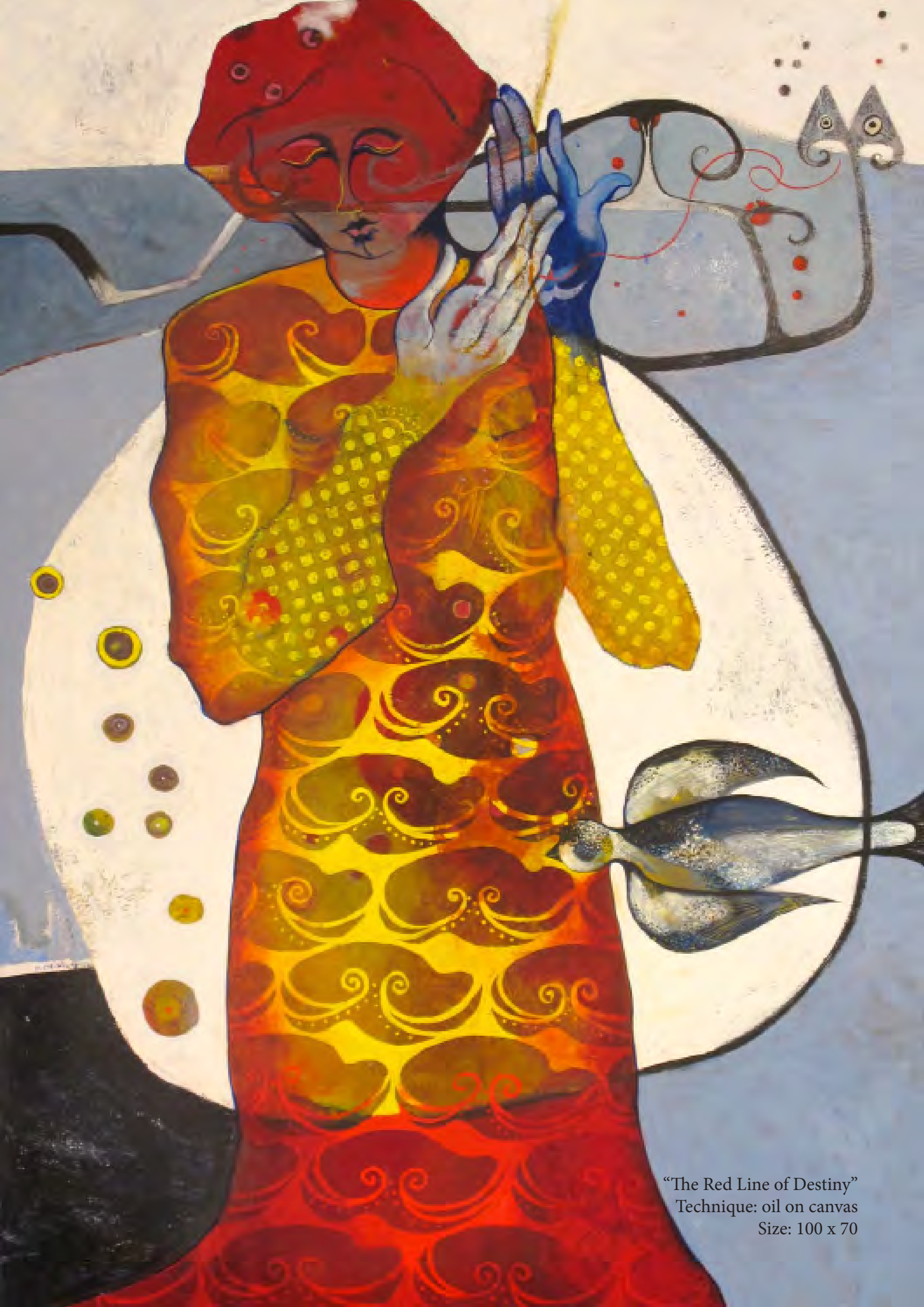
“The Red Line of Destiny” Technique: oil on canvas Size: 100 x 70