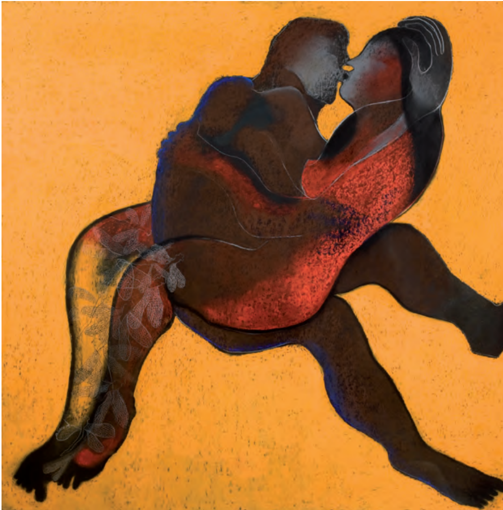
”The Lovers of Zumpa Beach” Technique: pastel on canvas Size: 100 x 100