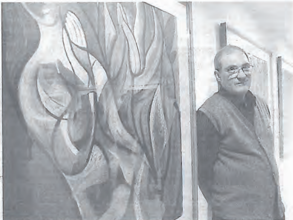
ESPÍRITU DE UN CONTINENTE. El autor argentino posa junto a uno de los cuadros expuestos.