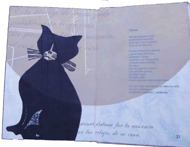
“All the kisses to you” Artist book, technique: Collagraph + xilography + digital font.