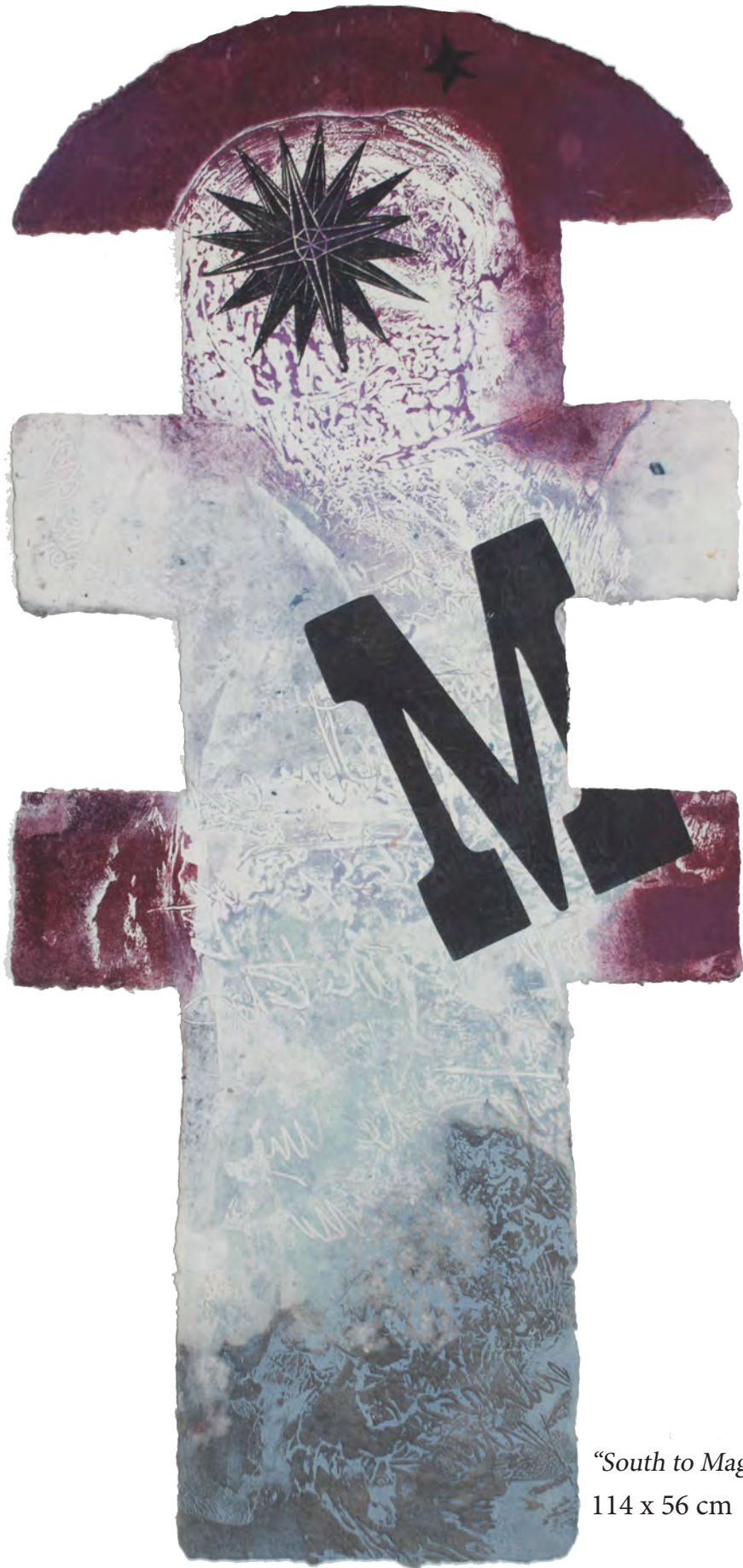
"South to Maga"