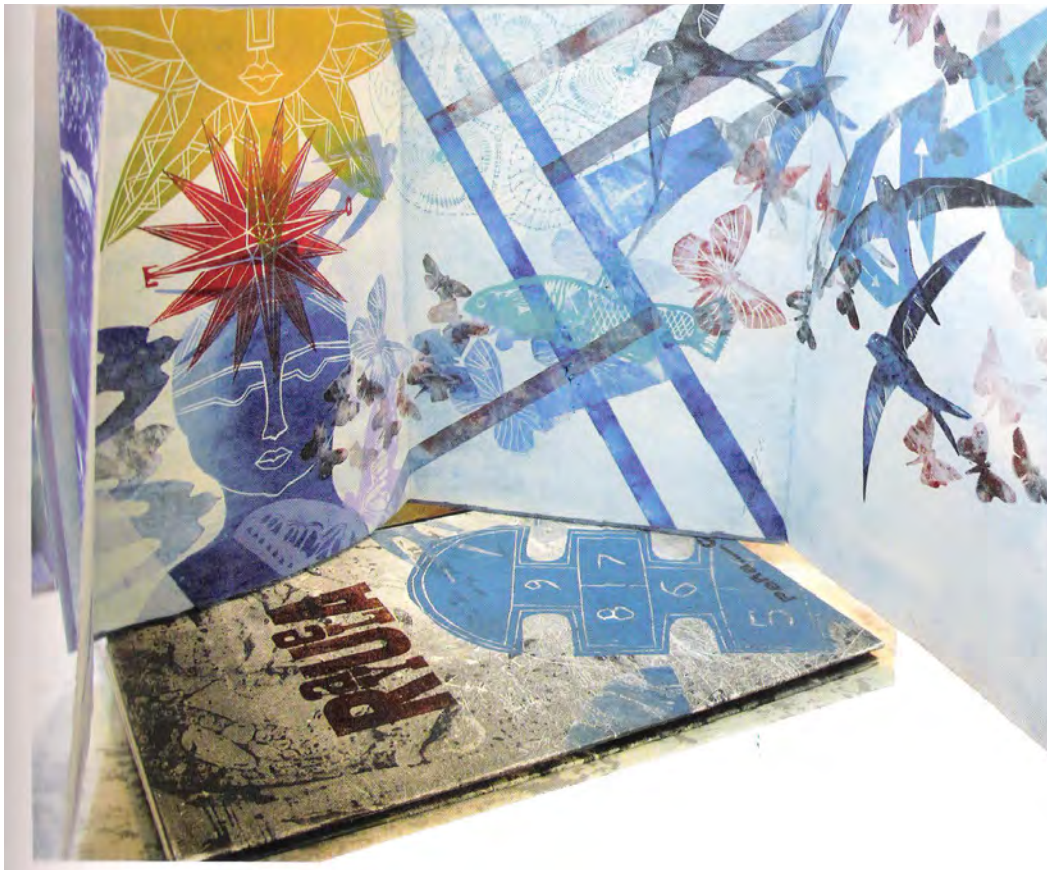
“Rayuela” (Hopscotch) Artist’s Book, techni- que: 4 interior prints in both sides, on the following themes 1- Maga 2- The exile 3- Friends 4- París Protective box printed with wooden letters + interior colophon Protective sleeve with relief. On 300 gram Super Alfa paper. One-of-a-kind copy. Done in collaboration with the artist José M. Peña.