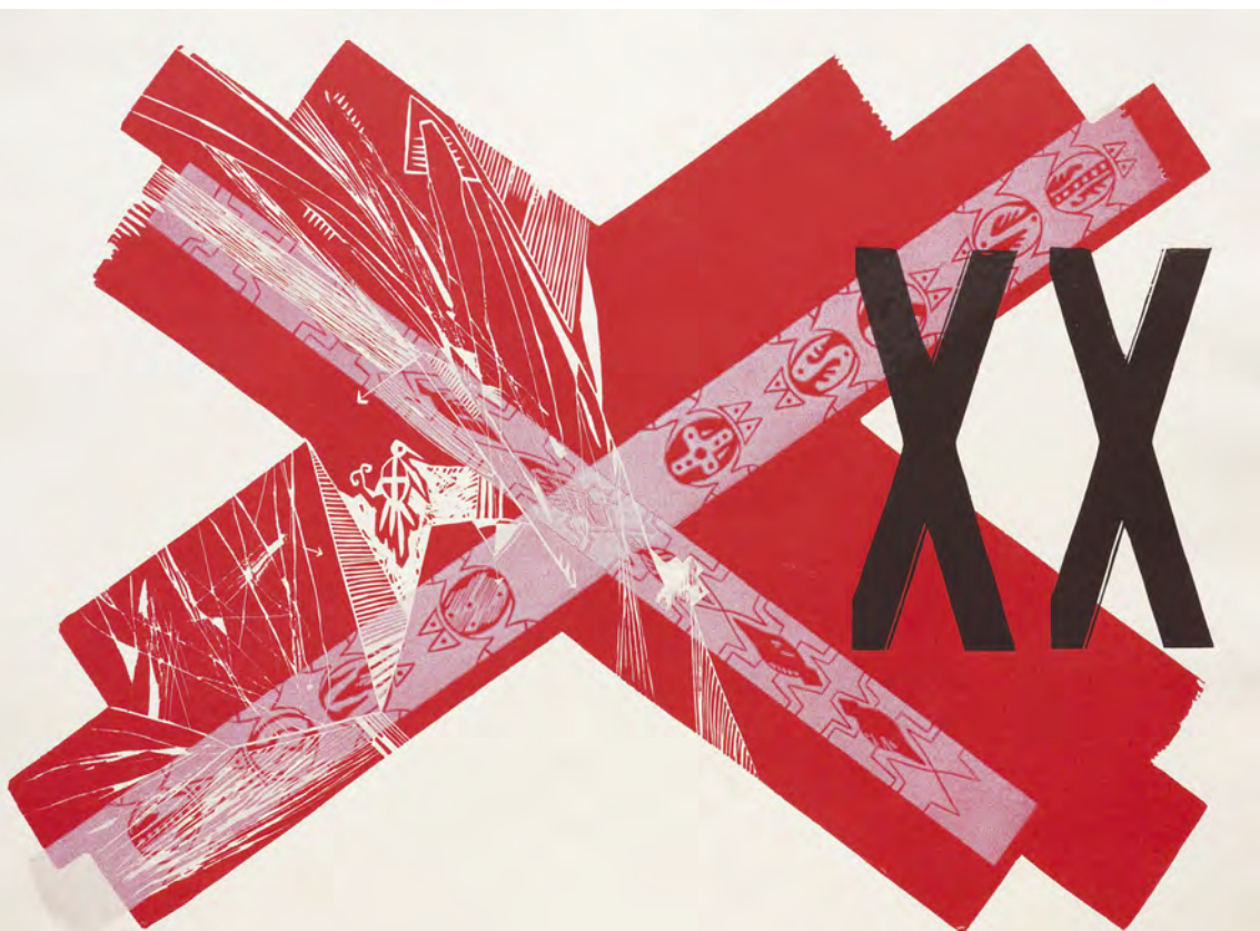
“Night in Temperley” Technique: cromo- xilography on paper of 250 gr. Size: 56 x 76 cm