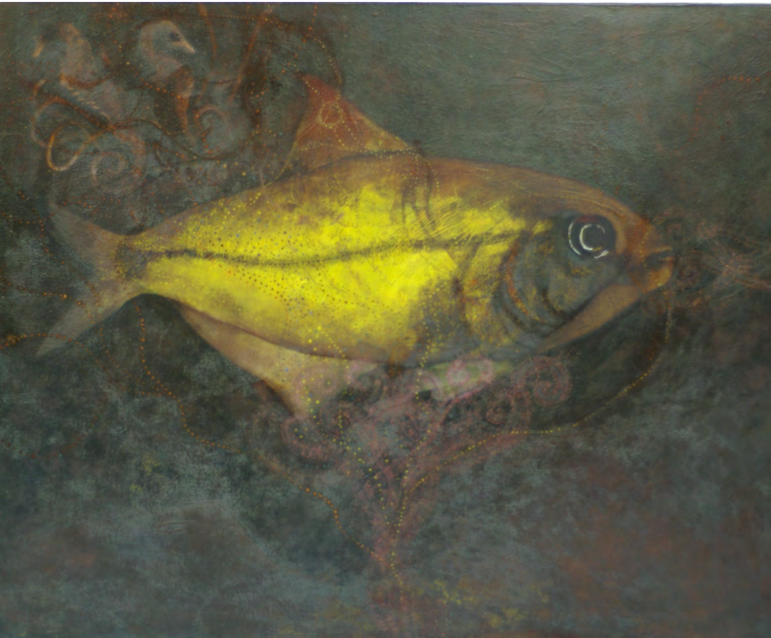
“At 5 He comes to Greet Me” Technique: tempera + oil on canvas Size: 73 x 92 cm.