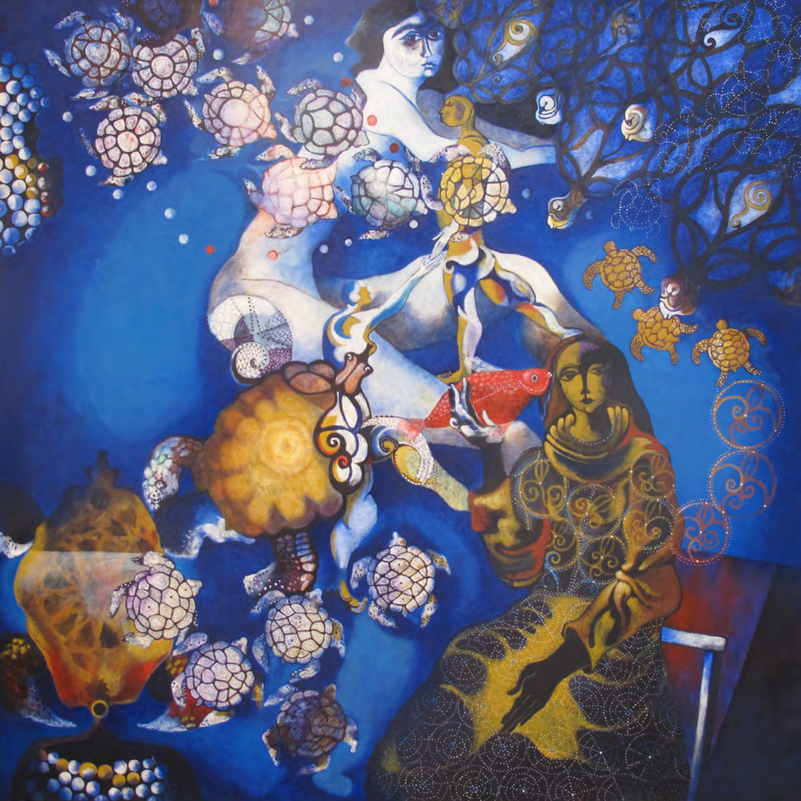
"The Long Road to Spawning" Technique: oil on canvas Size: 150 x 150