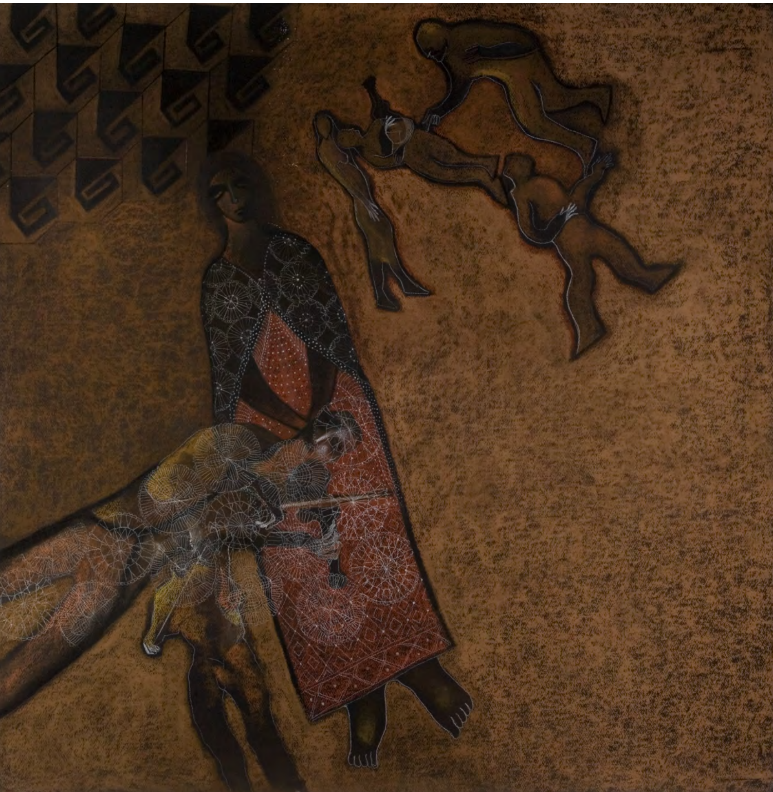
"The Violinists of Santiago" Technique: pastel on canvas Size: 100 x 100